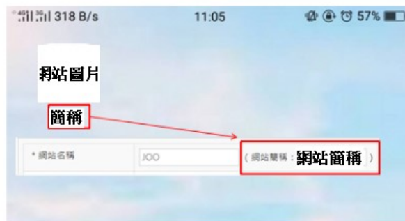
網站簡稱會在手機主選單會顯示